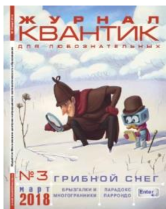
Примеры статей. №3 (2018)

ежемесячный журнал для любознательных школьников.