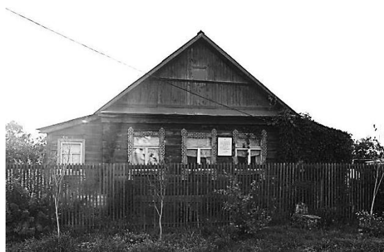
Дом-музей А. И. Мусатова в деревне Лизуново

Война оставила глубокий след в жизни писателя, оказала огромное влияние на его последующее