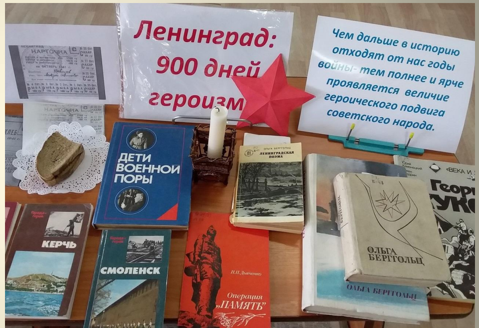
Акция памяти «Блокадный хлеб»