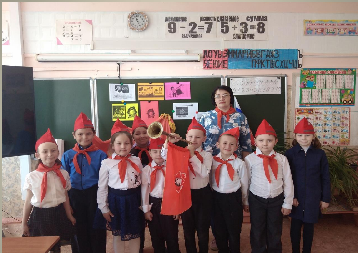
19 мая исполнилось 100 лет со дня основания Всесоюзной пионерской организации им. В.И. Ленина.