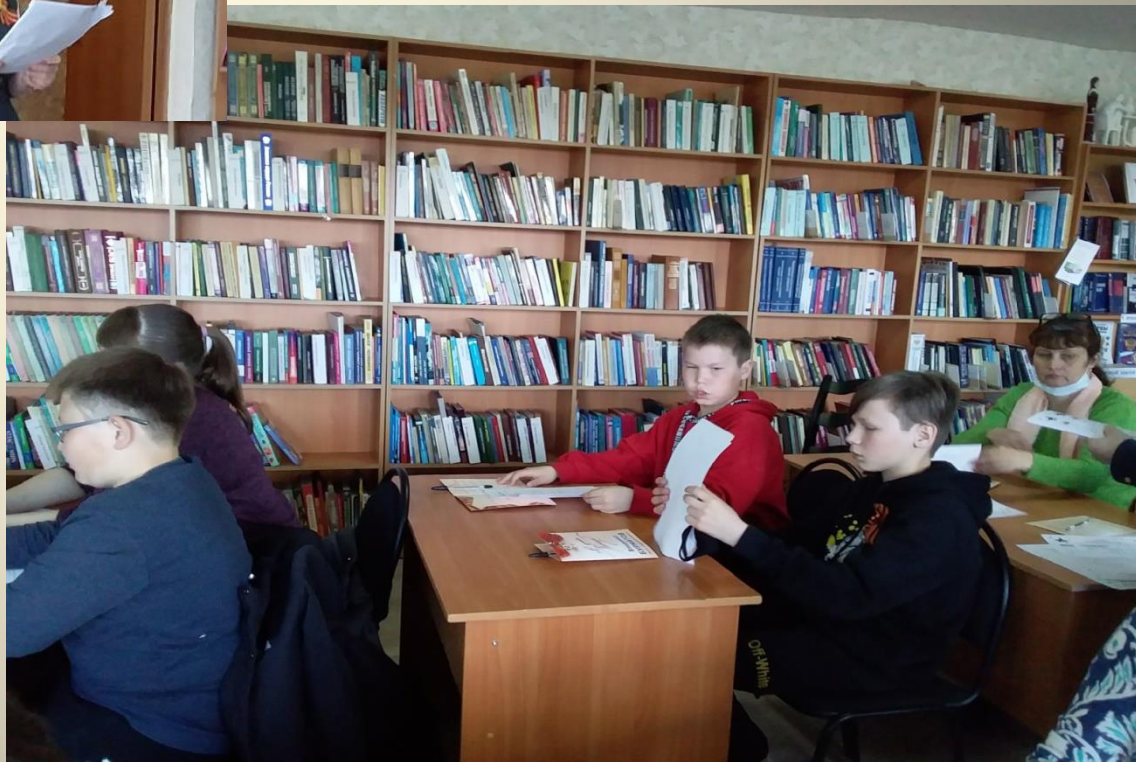
Всероссийский Диктант Победы.