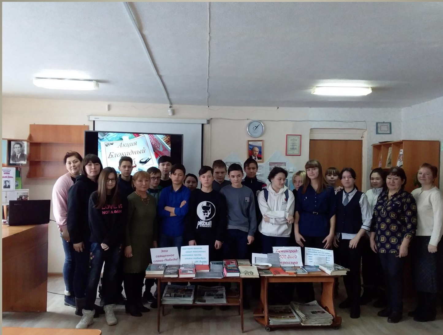
Урок памяти «Бессмертный подвиг Ленинграда» (27 января - День снятия блокады Ленинграда),