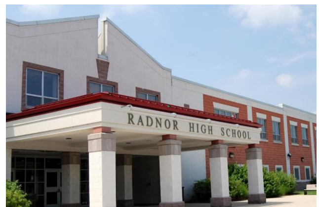
Школа в округе Рэднор