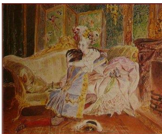
К.П. Брюллов «Прощание», 1847 - 1849

Список иллюстраций к бессмертным творениям Пушкина дополняет работа художника «Прощание» (1847 –1849) – иллюстрация к роману «Арап Петра Великого». Долгое время работа считалась утерянной, сейчас она хранится в фондах Государственной Третьяковской Галерее.